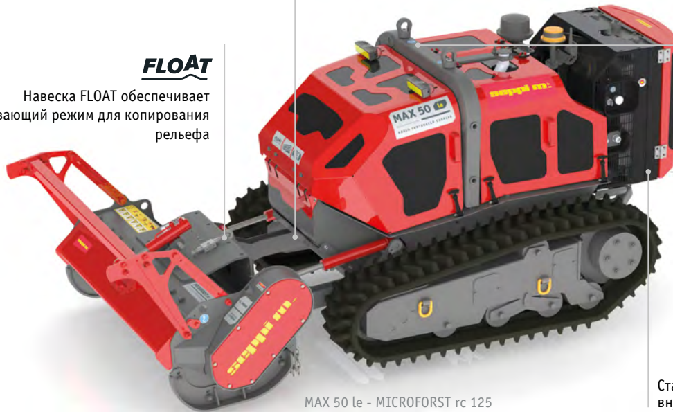
MAX 50 le - MICROFORST rc 125

Навеска FLOAT обеспечивает плавающий режим для копирования рельефа