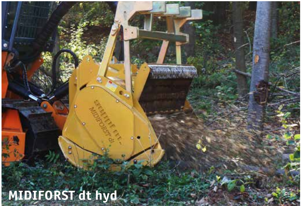
MIDIFORST dt hyd